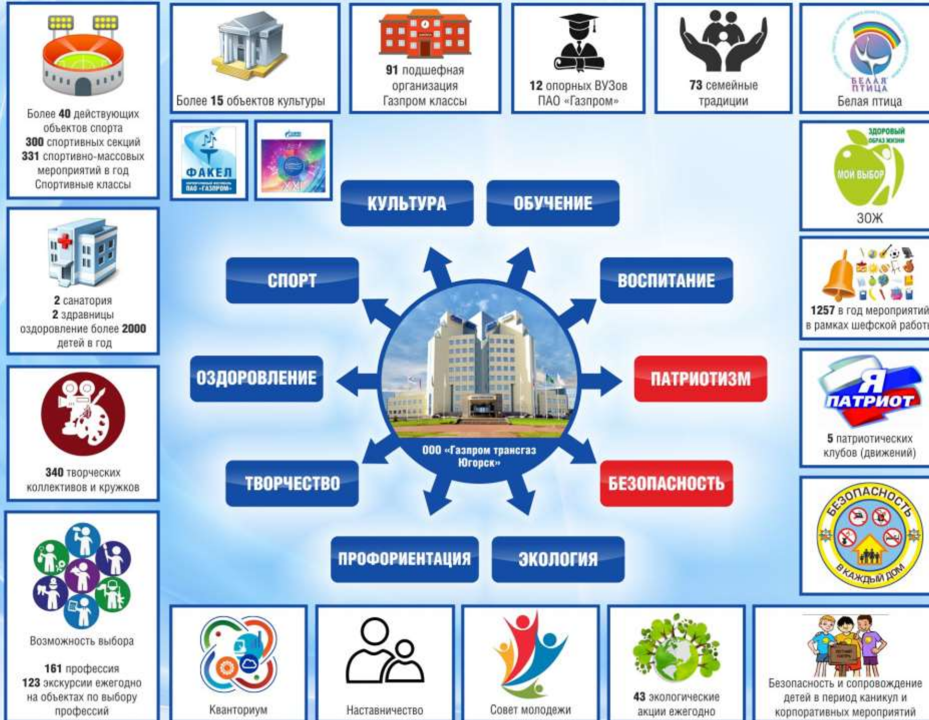
СХЕМА СИСТЕМЫ ООО «ГАЗПРОМ ТРАНСГАЗ ЮГОРСК» ПО РАЗВИТИЮ ДЕТЕЙ И МОЛОДЕЖИ